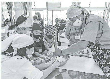
福祉体験教室の様子

町内の小中学校の福祉体験教室や福祉協力校活動助成金、高齢者及び障がい者の方への紙オムツ券配布等に使われています。