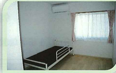
体験部屋 居室2部屋