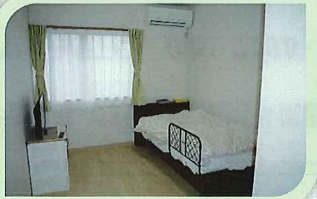
共同生活援助 居室7部屋

明和の「和」はやわらかいという意味があり、皆が住み馴れた明和町でやわらげるという意味を込めて名付けました