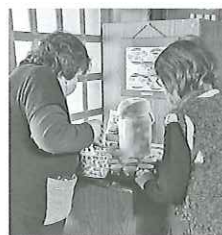
参加者へお茶出しするメンバー

カフェ寺スは平成30年6月に、地域の人々の交流の場をつくろうと発足しました。毎月第1第3水曜日の10時～11時半に明星山轉輪寺で開催されるサロンでは、手作りコンサートや雛人形づくりなど、季節に応じた魅力的なイベントが開催されていますが、メンバーが意識している事は、あくまで「つながりづくり」です。多くのメンバーがイベント毎に活躍されていますが、今回お話を伺ったメンバーの半数は、元々こういったサロンイベントの参加者だったそうです。