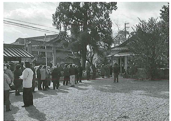
満月限定御朱印を求めて長い行列!