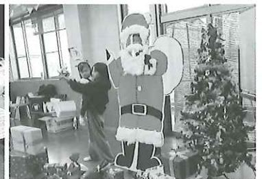
ここが本日の一番の 映えスポット