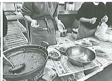
笑顔とともに提供された カレーライス