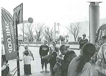
シュートは一人ずつ、 楽しさはみんなで!!

生活協同組合コープみえ様、アラピカケ様、CherryBonBon様、ぱる♪様、StudioEARLY様、ぎゅーとらラブリー明和店様、えがおの輪PROJECT様、子育てサロン鈴の種寧様、アーナダ&スーリヤ様、三重県立明野高等学校様、いっちゃん家様、明和町ボランティア連絡協議会様、mahina様、第2南勢就労支援センター様、ぱんカンぱん様、こいしらの里様、お菓子工房M様、めい姫様など多くの企業、団体、ボランティアの方々に参加していただき、心より感謝申し上げます。皆さまの温かいご支援とご協力があったからこそ、今年のふれあい祭りも無事に開催できました。今後とも地域の絆を深める活動にご協力いただければ幸いです。