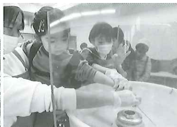
綿菓子作りに挑戦 くるくる回して… できてきた☆